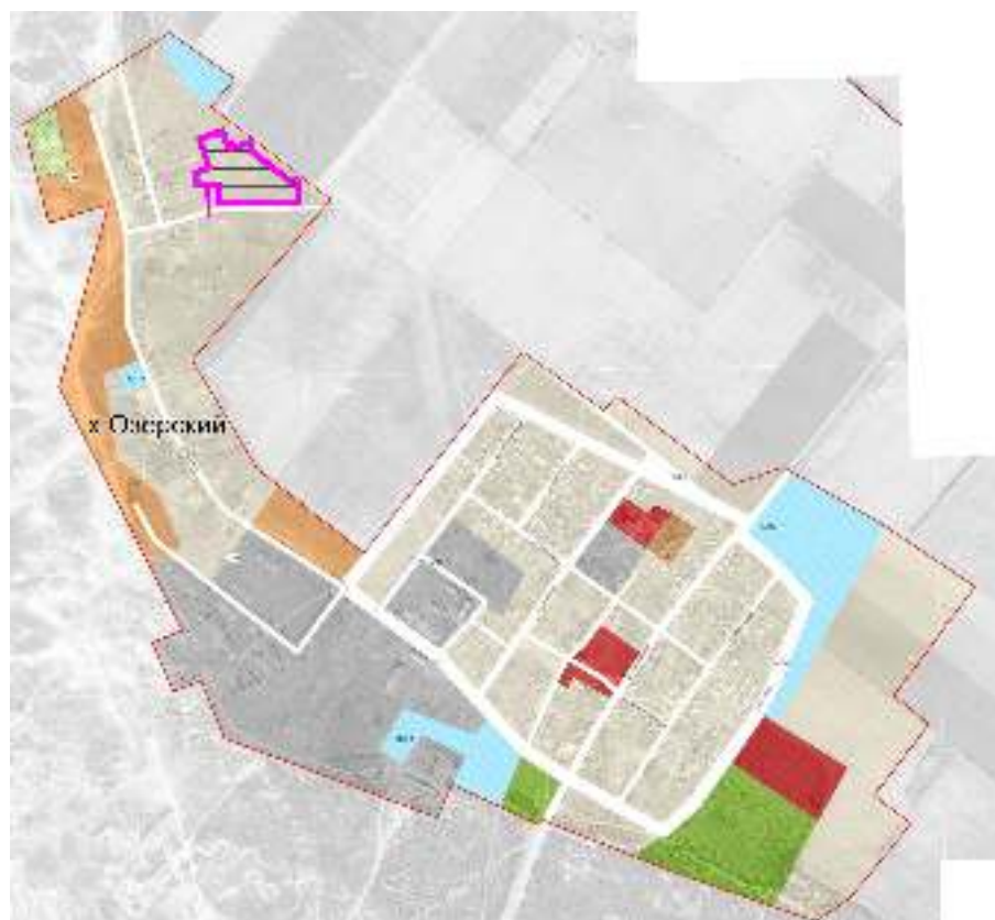
Схема расположения элемента планировочной структуры М 1:25 000